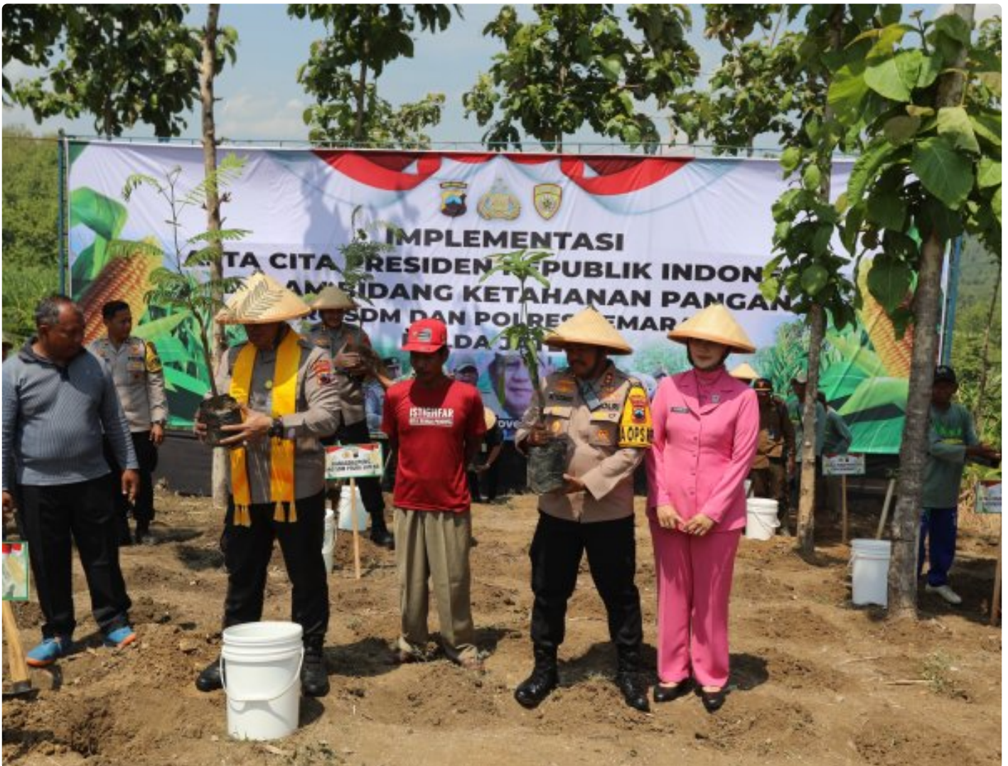
Foto: Polda Jawa Tengah menggulirkan aksi besar penanaman 1,8 juta pohon di seluruh wilayah Jawa Tengah. Pada Selasa (5/11/2024).

Kabupaten Semarang- Dalam semangat mendukung ketahanan pangan nasional dan kesejahteraan petani, Polda Jawa Tengah menggulirkan aksi besar